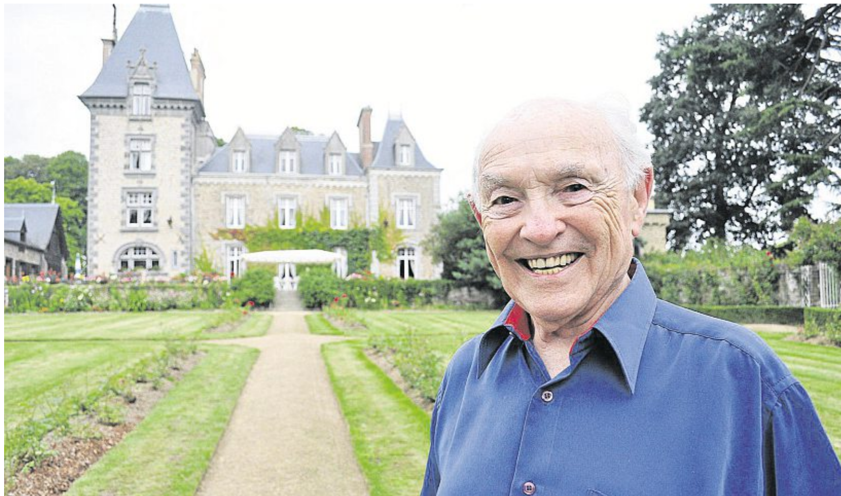
Le docteur Yves Cotrel, chirurgien à la retraite de 86 ans, reconnu pour son invention : un appareil qui soulage le dos des opérés de la scoliose.

Yves Cotrel sera honoré par la mairie de Dinan le vendredi 26 août. Une plaque sera inaugurée sur la maison d'enfance de ce docteur au grand cœur.